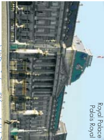
Royal Palace Palais Royal