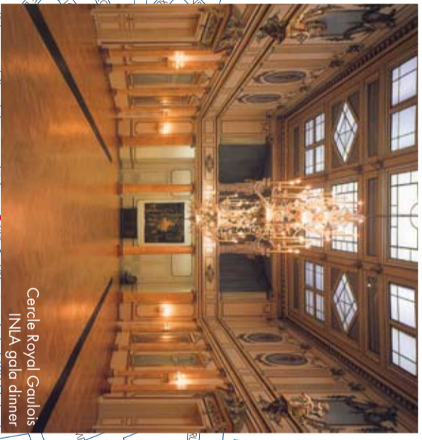
Cercle Royal Gautois INLA gala dinner