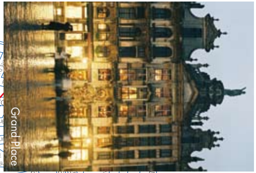
Grand Place