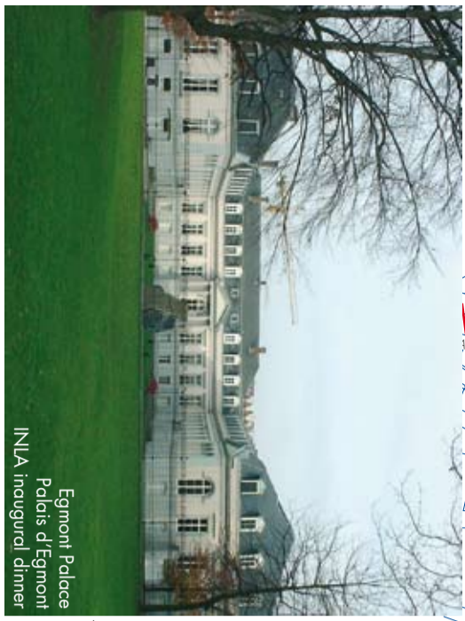
Egmont Palace Palais d'Egmont INLA inaugural dinner