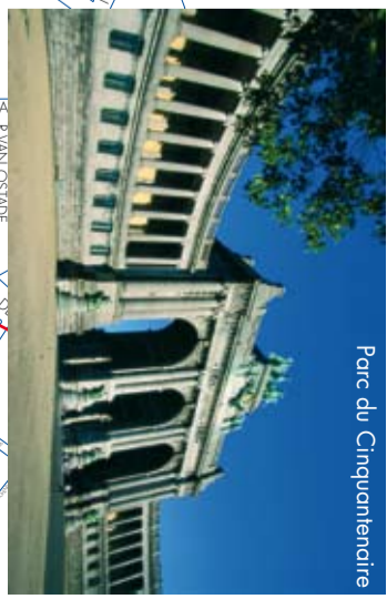
Parc du Cinquantiennaire