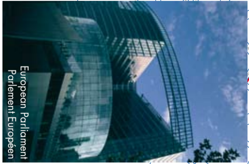
European Parliament Parlement Européen