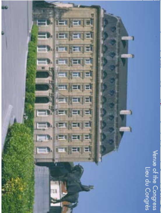
Belgian Federal Parliament Parlement Fédéral de Belgique Venue of the Congress Lieu du Congrès