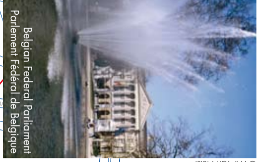
Belgian Federal Parliament Parlement Fédéral de Belgique © M. Van Hults